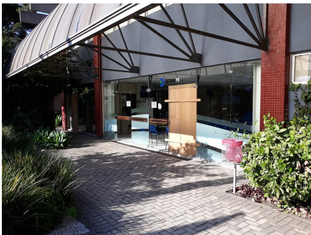
Imagem 4. Fachada atual do Bloco D, porta quebrada.