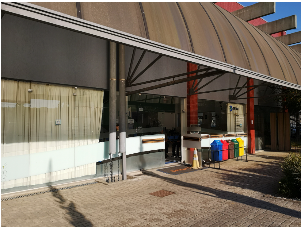
Imagem 1. Acesso atual do Bloco D com deficiência de acessibilidade.

Será feita a relocação de uma galeria de drenagem, visto que a mesma se encontra em frente de uma futura porta de vidro e também instalaremos soleiras de granito em toda a extensão para formar uma base sólida para o vidro e alinhar ao piso interno.