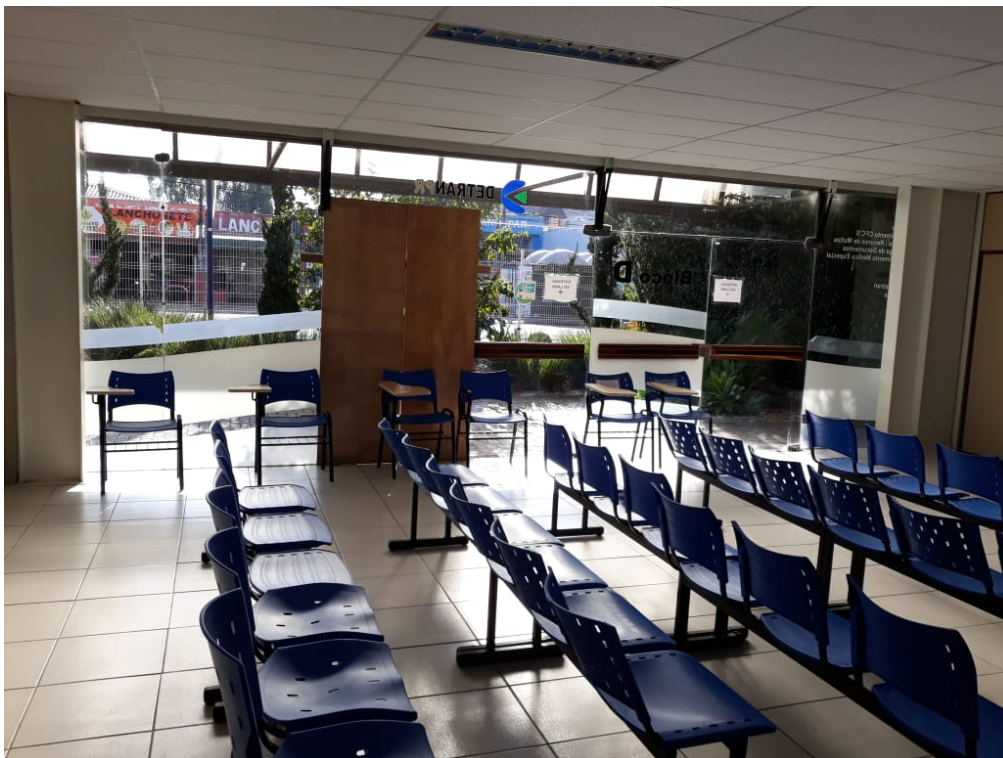
Imagem 3. Lado interno fachada atual do Bloco D, porta quebrada.