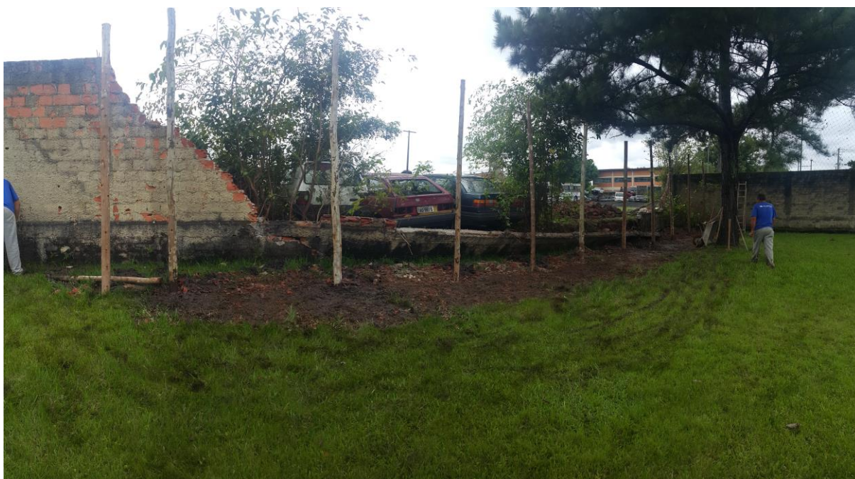
Imagem 1. Muro derrubado pelas chuvas.

O muro do pátio de veículos apreendidos necessita ser reconstruído em uma extensão de aproximadamente 25 (vinte e cinco) metros. Será executado estacas para a fundação de 0,5 metros a cada metro e viga baldrame em toda sua extensão. O muro terá pilaretes com modulação a cada dois metros.