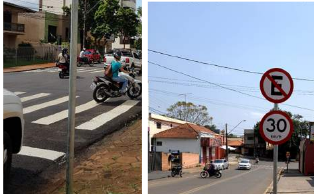
SINALIZAÇÃO HORIZONTAL E VERTICAL EXECUTADA PELO DETRAN/PR